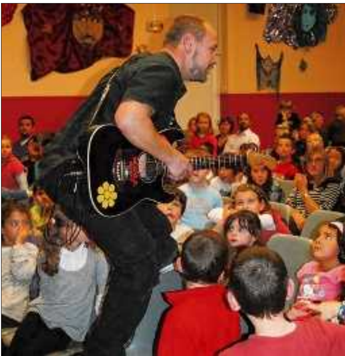
L'artiste a quitté la scène pour se mêler aux enfants.

Pour clore la semaine d'animation de la Toussaint, la MJC a été le théâtre d'un spectacle jeune public qui a réuni cent cinquante-trois enfants. Le spectacle s'intitulait Am Sam Gram . Basé sur une approche différente de la musique pour enfant, il oscillait entre humour et poésie. Un temps très apprécié par les enfants qui sont devenus par moment acteurs pour leur plus grande joie. Les deux artistes mêlant chants, comptines et histoires drôles ont reçu les applaudissements du public qui a passé un très bon après-midi de fin de vacances.