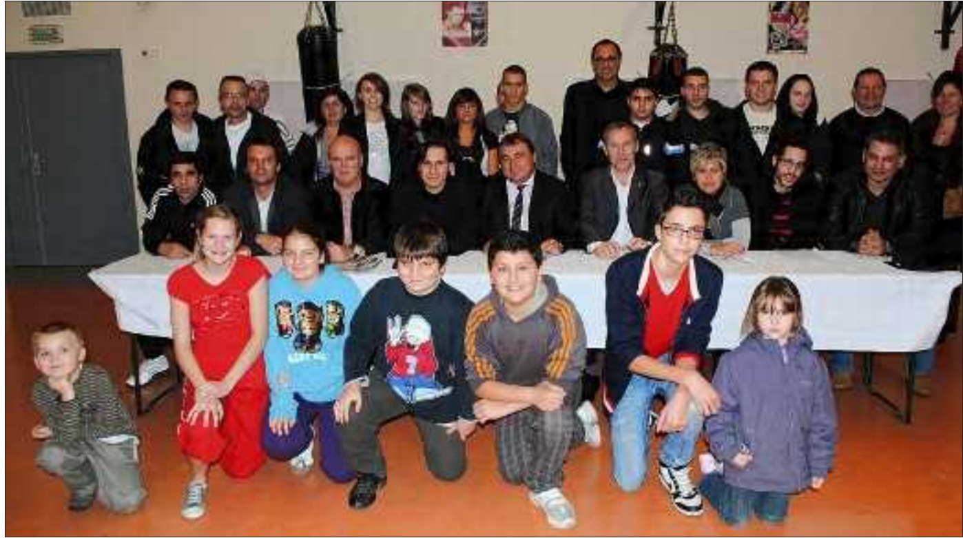
L'Asby, un club qui a le vent en poupe.