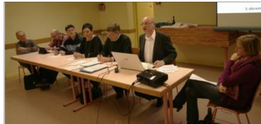
Le dynamisme de l'association Mercredi loisirs se traduit par un solide programme d'activités.